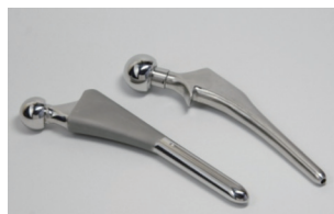
COBARION から作られる二次加工品 インプラントや人工関節など様々な医療分野で活用されている。