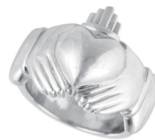
金属アレルギーの方でもジュエリーを楽しめる。ポール・コストロ氏のデザインによる COBARION ジュエリー「クラダリング」(京セラ)